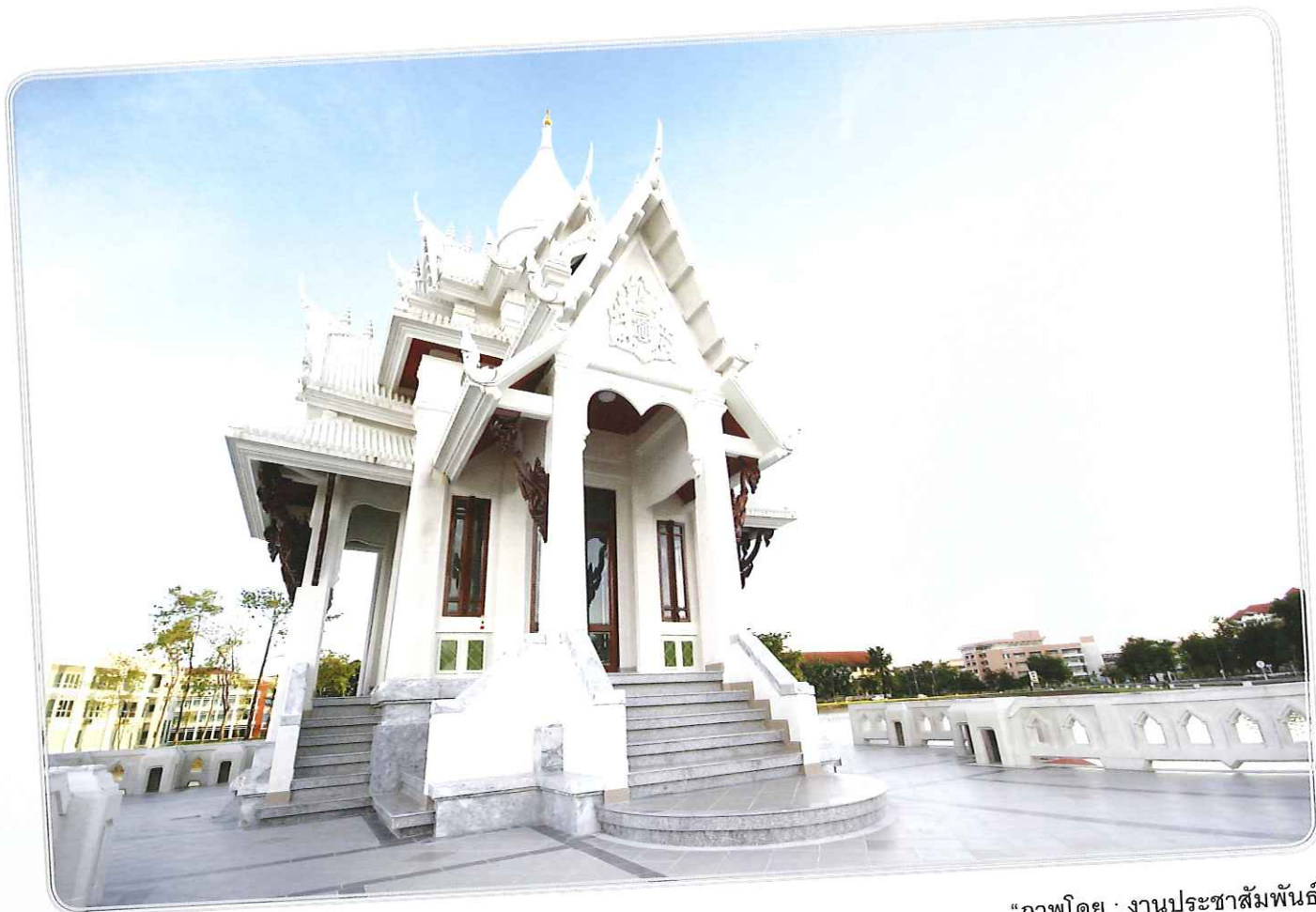
“ภาพโดย : งานประชาสัมพันธ์”